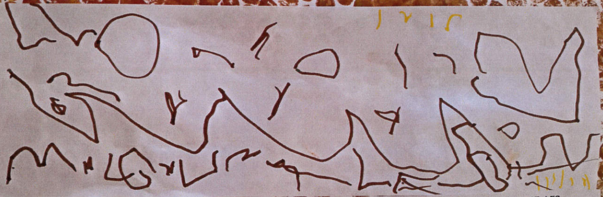
L'UNICORN, LA BRUIXA I EL LLOP COMPARTIREN EL PASTÍS I APRENGUEREN A ESTAR JUNTS, MALGRAT LES DIFERÈNCIES.