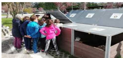
Exemple de contenidors compostadors municipals

Amb compostadors d'un metre cúbic es poden arribar a tractar les restes de trenta famílies i obtindre de cent a dos-cents quilos