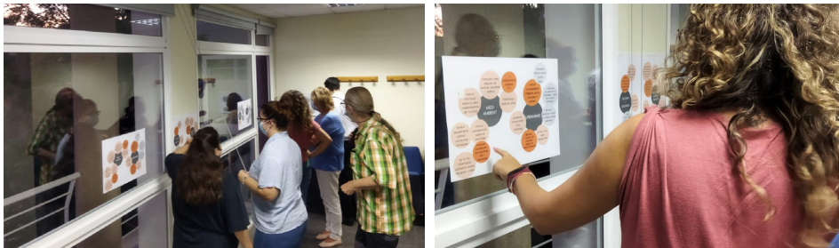
Fotografies preses durant la sessió de devolució amb el Fòrum Veïnal

Com a conclusió d'aquestes sessions, s'exposen a continuació les problemàtiques matisades i incorporades així com un resum de totes elles i els resultats de la prioritització.