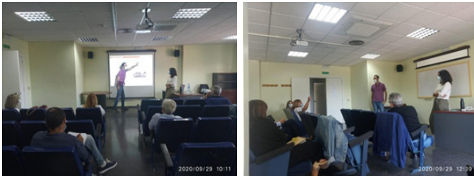
Fotografies preses durant la reunió formativa i el posterior taller de diagnòstic

dinàmiques participatives previstes aquell dia per tal de desenvolupar una primera aproximació tècnica al diagnòstic perceptiu de salut.