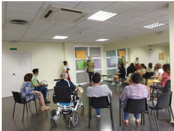
Fotografies preses durant la sessió del taller de diagnòstic amb el Fòrum Veïnal, concretament en la part final de posada en comú.

Finalment, es van dedicar 30 minuts al plenari, en el qual la persona que va moderar cadascuna de les taules de treball va exposar tot el plantejat durant les taules i, de manera col·lectiva, es va continuar matisant o ampliant el contingut.