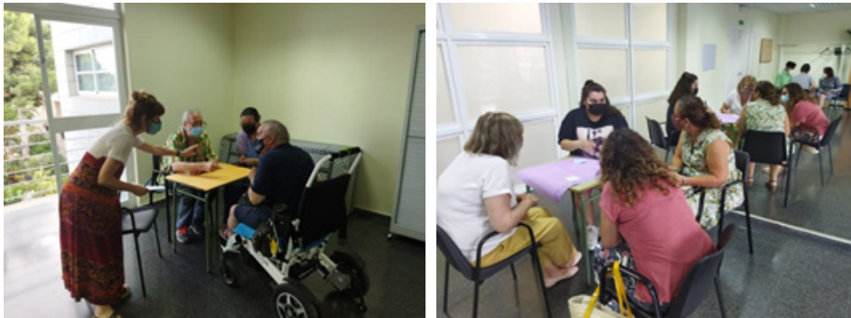
Fotografies preses durant la sessió del taller de diagnòstic amb el Fòrum Veïnal, concretament en la part per grups.

Finalment, es van dedicar 30 minuts al plenari, en el qual la persona que va moderar cadascuna de les taules de treball va exposar tot el plantejat durant les taules i, de manera col·lectiva, es va continuar matisant o ampliant el contingut.