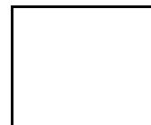
CONSEJO GENERAL DE PROCURADORES